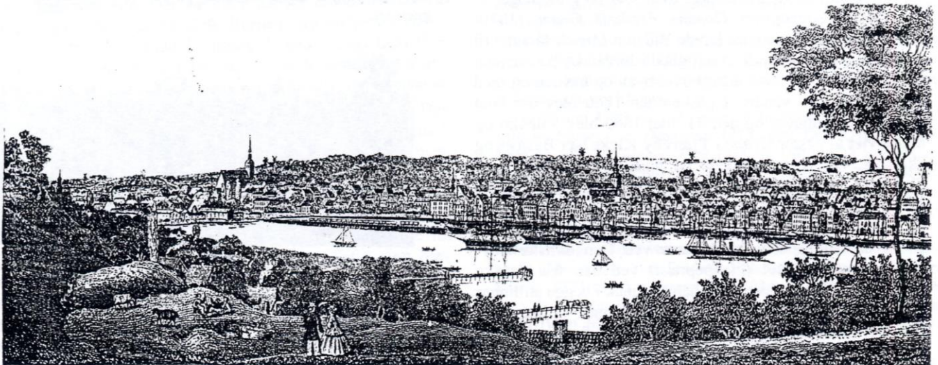
Flensburg vom Ballastberge aus gesehen.