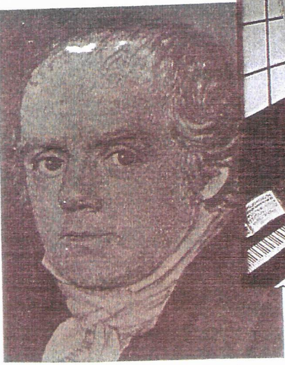
BLEV I 1799 sognepræst i TRANEKÆR-TULLEBØLLE og virkede her til sin død.