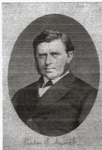
Fig. 93. Vilhelm Munck , u.å.